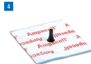
Ampacoll® Elektro/Install Vorgefertigte Manschetten