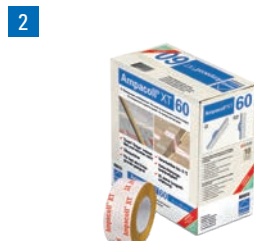
Ampacoll® XT 60 Acrylklebeband